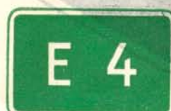
fig. 53 c. Vägnummärke för internationell huvudtrafikled.