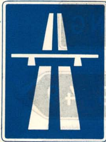
fig. 37 a. Plats, där motorväg, med eller utan skilda körbanor, börjar.