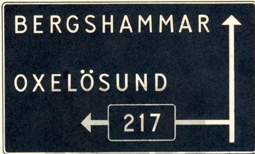
fig. 54 a. Orienteringstavla.