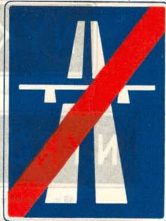
fig. 37 b. Plats, där väg upphör att vara motorväg.