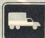
fig. 50 d. Vägvisning avseende förbifartsväg för tunga, höga eller breda fordon.