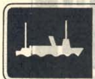
fig. 50 b. Vägvisning avseende väg till färja.