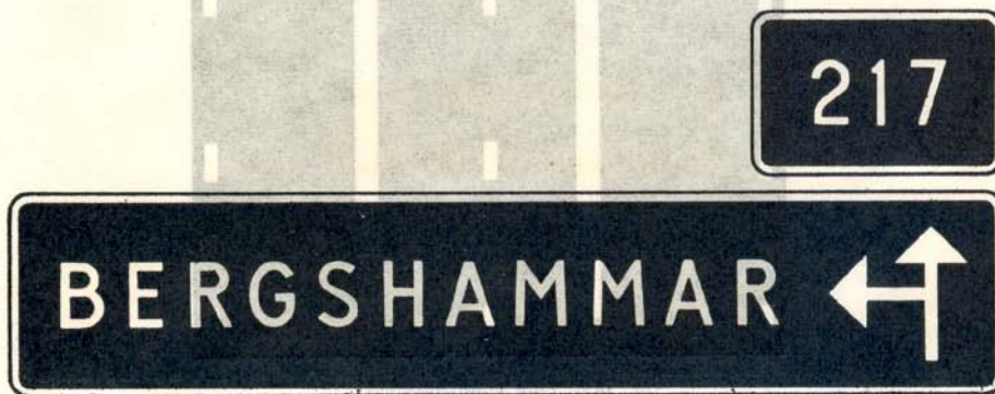
fig. 54 b. Orienteringstavla med vägnummermärke.