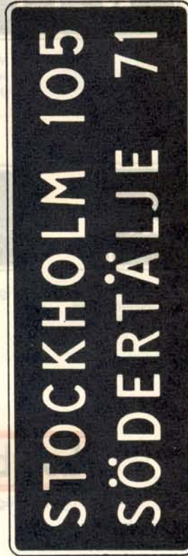
fig. 49 a. Avståndstavla.