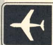
fig. 50 c. Vägvisning avseende väg till flygplats.