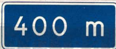
fig. 37 c. Tilläggsstavla att anbringas under motorvägsmerke.