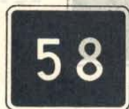
fig. 53 a. Vägnummärke.

hög, stora fordon och tråda, polig avsläppta