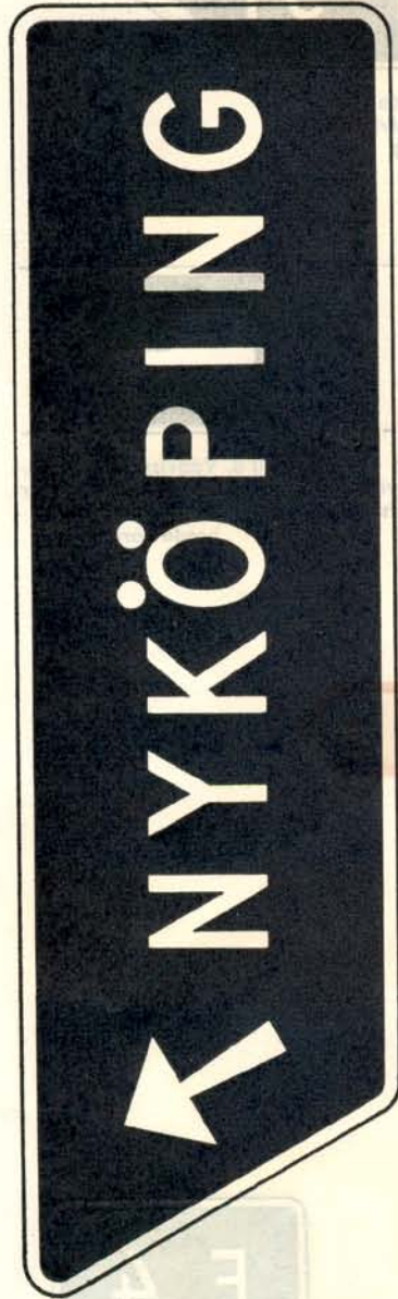
fig. 48 e. Avfartsvisare.