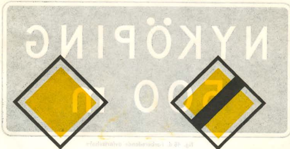
fig. 38. Huvudled.