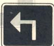
fig. 53 b. Tilläggstavla till vägnummärke.