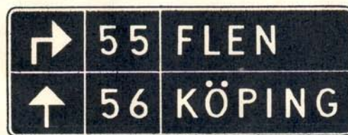
fig. 54 c. Orienteringstavla, förenklad, inom tätbebyggd ort.